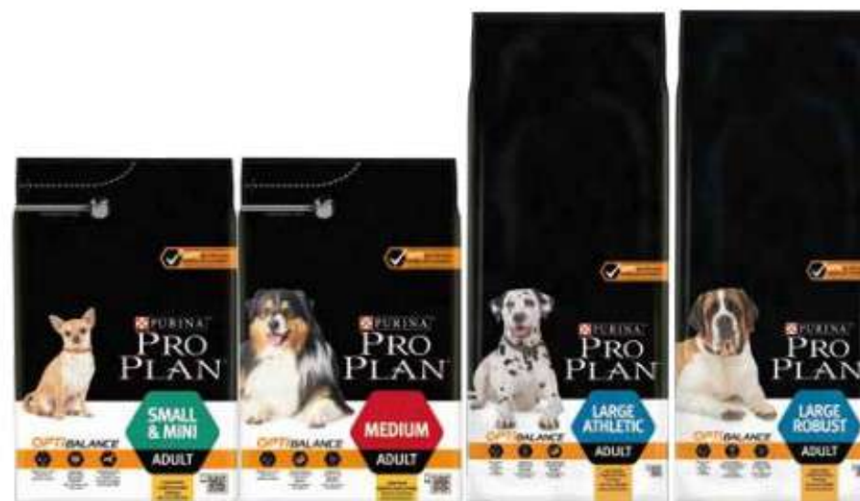
Purina® PRO PLAN® Small & Mini Adult con OPTIBALANCE