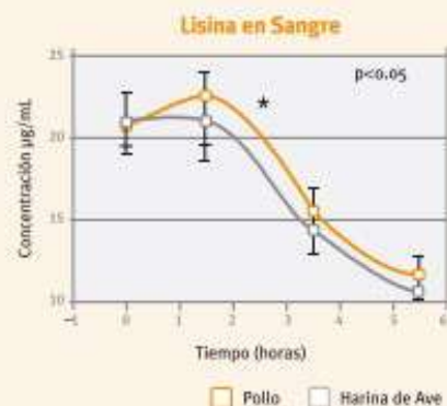
Figura 1: Valores de lisina en sangre en los perros alimentados con pollo o con Harina de Ave.